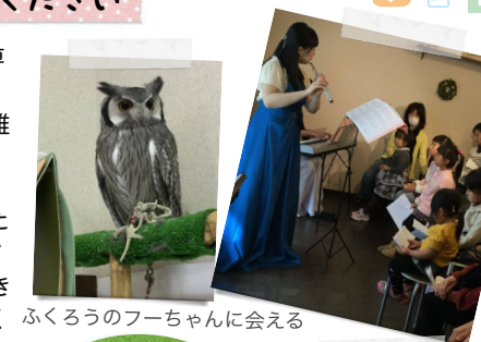
ふくるろうのフーちゃんに会える

オススメポイント 月1回の0歳からのおはなしくらぶ(参加費300円)は、赤ちゃんがたくさん参加している人気のおはなし会です。7回参加すると、何と絵本のプレゼントがあります。これは、嬉しい!