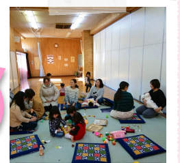
ママのおしゃべりサロンの様子

利用者の声 「子どももお友達と遊べて楽しいし、私自身のリフレッシュにもなります」