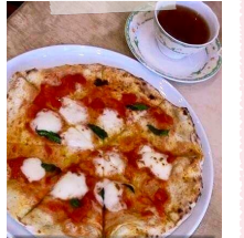
本格ピザ窯500度で焼く熱々のピザは好評です

利用者の声 「ここでの講座を通してママ友が出来ました！繋がりが出来て嬉しいです」