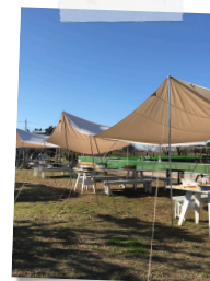
キングフィッシャーガーデン

オススメポイント 遊び疲れたら敷地内の「numa café」へ。窓からは広大な手賀沼が見渡せ、絵本も置いてあるのでソファでゆったりと過ごすことができます。