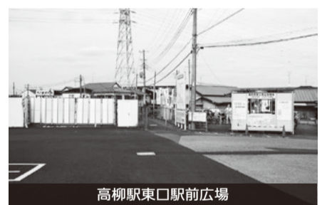
高柳駅東口駅前広場