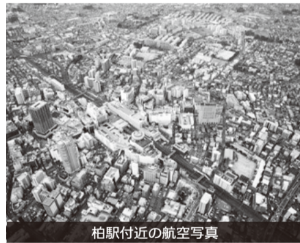
柏駅付近の航空写真