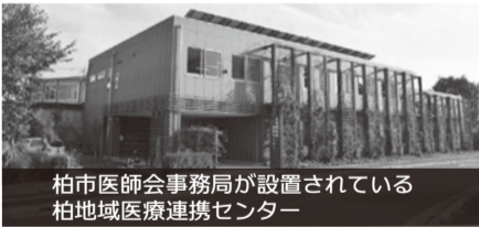
柏市医師会事務局が設置されている 柏地域医療連携センター

A今後、柏市医師会が市内の診療所を取りまとめ、本市との集合契約により診療所がPCR検査や抗原検査に参加できる体制も準備されることから、検査体制の拡充が図られていく。