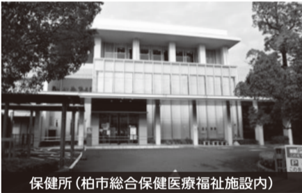
保健所(柏市総合保健医療福祉施設内)

A国内で発生し始めた2月頃から電話での相談業務が急増、3月以降は感染者の発生増加に伴い、積極的疫学調査や健康観察を担う職員に負担が集中。そこで、保健所内において業務の縮小や延期を行ったほか、保健所内各課の役割分担を定めて、全体で対応。4月以降は、全庁的な体制構築の中で応援職員を中心としたコールセンターを設置したほか、保健師を中心に保健所以外の部署の職員派遣で対応。6月末からは、保健所全体での協力体制を強化するとともに、他部署からの職員派遣の協力をいただいている。