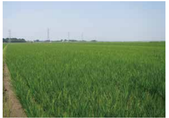
青々とした稲が広がる田んぼ