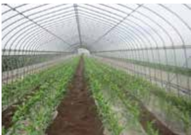
順番に種がまかれたハウスの中