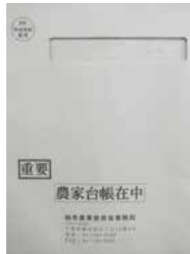
郵送した封筒見本

今年度も、7月下旬に農家の皆さんへ、農家基本台帳を郵送しました。記載要領を確認のうえ、必要事項を記入押印し、提出をお願いします。