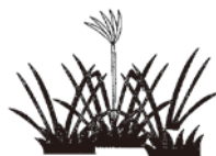
耕作されていないたんぼや畑