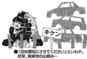
■「田村園地にさせてください」といわれ、結果、廃棄物の山積み…