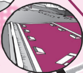
沼南高柳西郵便局