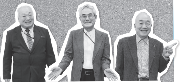
教えていただいた皆さん