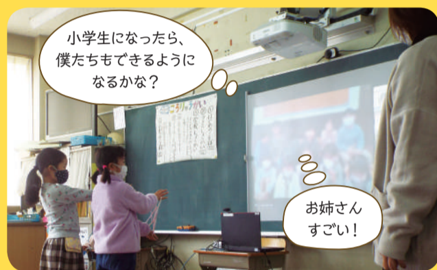
▲1年生が得意のあやとりを園児たちに披露 (中原小学校)

入学前にはなかなか訪れる機会のない小学校。新しい環境での不安を少しでも減らせるよう、小学校ではさまざまな取り組みが行われています。例えばオンラインを活用して、1年生と園児たちとの交流を図ったり、1年生と先生が心を込めて学校紹介動画を制作し、各園へプレゼントしたりするなどの工夫がなされています。