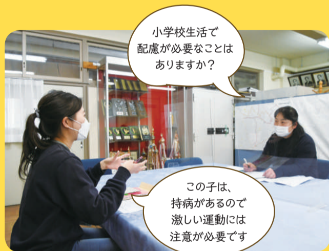
▲小学校の先生が入学予定の子どもたちについて聞き取りを行います (酒井根小学校)

入学の数カ月前には、各小学校の先生が幼稚園・保育園・こども園の先生から入学予定の子どもたち一人一人について聞き取りを行います。アレルギーの有無など学校生活を送る上で気に掛けるべきことがないか、事前に情報を得ることで、必要な配慮を十分に整えた状態で入学式を迎えられるようにしています。