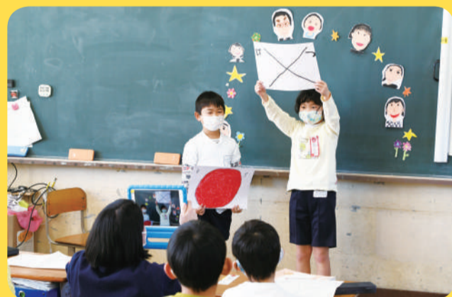
▲1年生と先生が学校紹介動画を制作 (西原小学校)