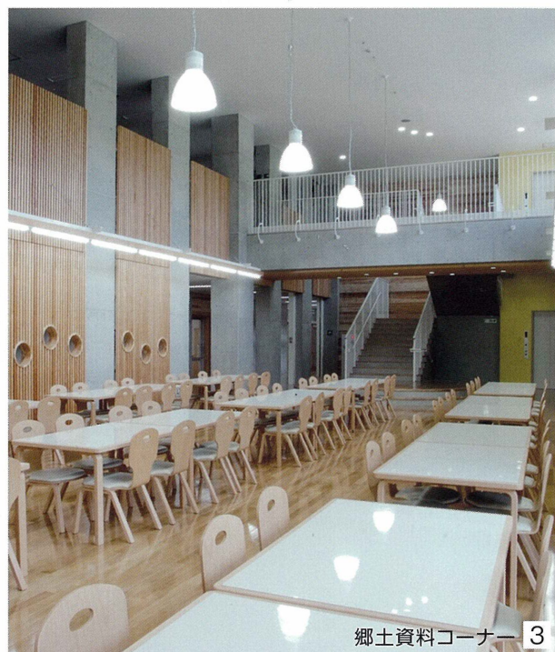
郷土資料コーナー 3