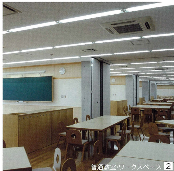
普通教室・ワークスペース 2