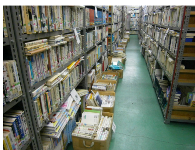
避難通路（上写真）及び他の通路（下写真）の状況