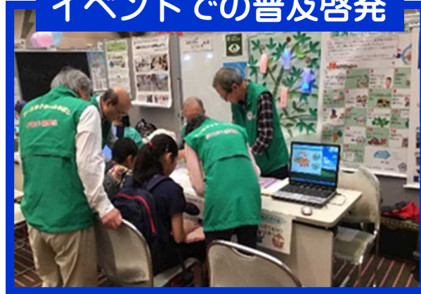
イベントでの普及啓発