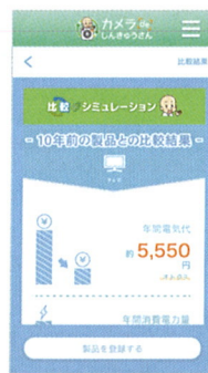
【カメラdeしんきゅうさん】

「カメラdeしんきゅうさん」は買い換えたい家電製品(エアコン、テレビ、冷蔵庫)の統一省エネルギーラベルをカメラで撮るだけで、10年前の家電製品との電気代や二酸化炭素排出量などが簡単に比較できます。