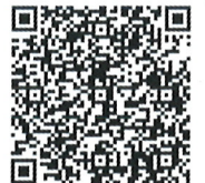
【パソコン版しんきゅうさんサイト】