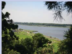
3-13手賀の丘公園展望台 広大な手賀沼沿いの風景を望むビューポイントです。