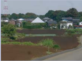
4-3若白毛の丘の上の眺め 斜面林、田園がきれいに並び景観が楽しめます。