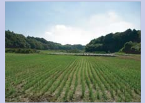
4-2若白毛の谷津田 独特の奥行きを持つ谷津田の風景が広がっています。