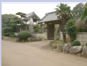
3-18ユニークな外構の農家 塀の前に石を積んだり植木を配した楽しい外構です。