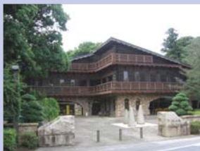
3-14手賀の丘公園センター 周囲の森に馴染んだ落ち着いた感じのあるデザインの建物です。