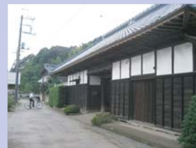
3-16下手賀沼周辺の長屋門 手入れされた、間口の長い長屋門です。