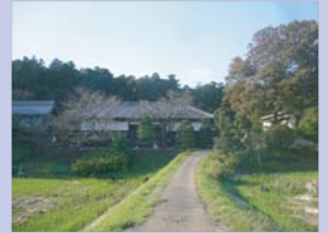
4-6藤ヶ谷の民家 長屋門と桜並木が谷津田風景のアクセントになっています。