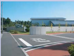
4-7バイクオークション施設 緑豊かな外構と低い屋根が周りの緑とマッチしています。