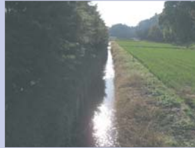
4-5藤ヶ谷の谷津田 狭い谷間に水田と水路、民家が並ぶのどかな風景です。