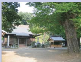
3-19弘誓院と立派な銀杏樹 2本のイチョウの巨木を有するお寺です。