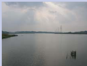
3-15下手賀沼 干拓で手賀沼と分離した下手賀沼の静寂な水辺風景です。