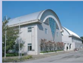
4-1沼南体育館 軽快で楽しいデザインが市民に親しまれています。

※地図上「○」は、ジャンボタクシーの停留所です。詳しくは市ホームページをご覧ください。