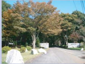
4-4藤ヶ谷カントリークラブ エントランスをはじめ、四季折々の樹林が印象的です。