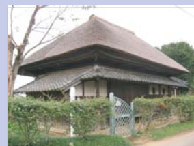
3-20旧手賀教会堂 珍しい茅葺き屋根の教会です。