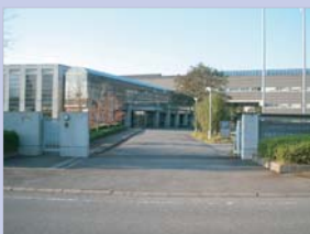
4-8電設工技術学園 洗練されたデザインで、落ち着いた雰囲気のある建物です。