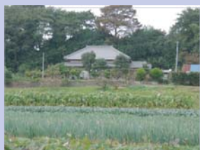
3-17下手賀沼の田園と農家 背後に屋敷林、前面に畑を持つ昔ながらの敷地づかいです。