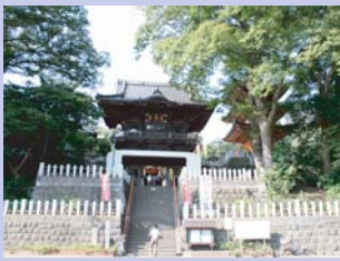
2-1布施弁天（東海寺） 関東三大弁天のひとつ。趣のある山門を持つお寺は、歴史を感じさせます。