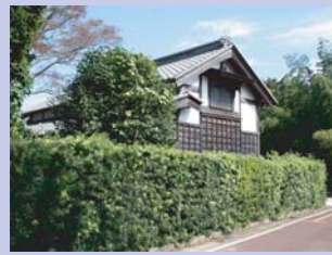
2-3農家の蔵 洗練された意匠と生垣・庭木が良く調和しています。