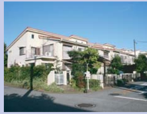
1-3北柏ライフタウン リズミカルなスカイラインの街並みです。