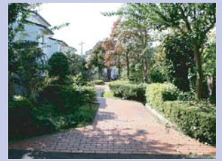
1-5 コープタウン北柏 住宅地内の道にも手入れされた緑があふれる表情豊かなタウンハウスです。