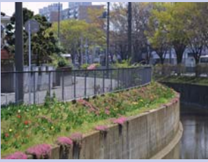
1-1地金堀の花々 3面張りの水路脇に植えられた芝桜などが季節感を醸しています。