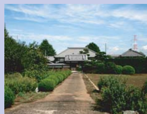
3-2整った造りの農家アプローチ 門、建物の配置や庭木など絵になるデザインです。