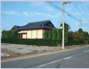
2-4布施街道付近の住宅 昔ながらの意匠や庭木などが地区の景観と調和しています。