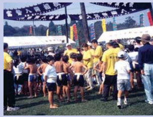
2-2八朔相撲 伝統的な行事の地域相撲を復活させ、新しいコミュニティの景観が生まれています。