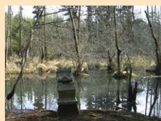
B-2 こんぶくろ池 手賀沼の源。木々に囲まれ、ひっそりとたたずんでいます。