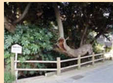
B-3 宿連寺の湧水 新しい街並みの狭間に、湧き出しています。

凡例 注※1 より良いまちづくりを目指し、地区のルールを(地)地区計画、(建)建築協定、(緑)緑地協定、(景)景観重点地区などに定めている地区です。 ※2 平成6年から行われていた景観探検隊の活動実績に加え、事務局のフィールドワーク等により、今後景観資源として育てていきたい良好な要素を抽出したものです。