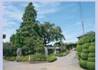
3-1覚王寺 立派な山門を持つ地区のシンボリックなお寺です。