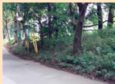
B-1 正連寺の野馬土手 野馬土手が残り、農家の家並みが続いています。