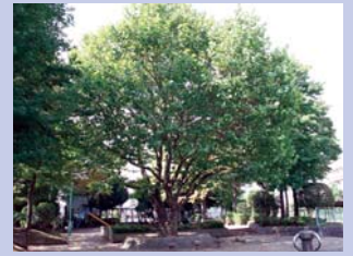
1-4松葉第四公園の大木 地域の人に親しまれるプラタナスの大木です。