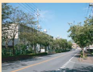
A-3富勢中学校前の桜並木 街路整備、周辺の住宅開発により、新しい街の雰囲気となっています。