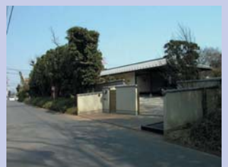
3-3落ち着いた雰囲気の民家 樹木や竹垣の外構や屋敷が、落ち着いた雰囲気を醸しています。