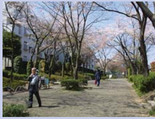
1-2美しい桜・ケヤキ並木 街並みの成熟を象徴する桜・ケヤキ並木です。