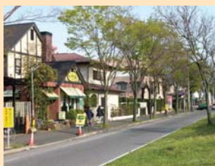
A-1松葉緑地を挟む道路 広々とした通りの空間に比較的低層・小規模な店舗が点在しています。