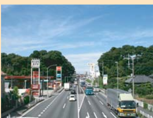
A-2国道16号 斜面緑地を抜けると、本格的なロードサイド景観がはじまります。