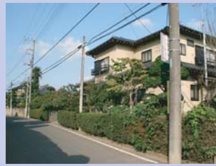
2-5布施街道付近の住宅 建替え前の庭木や生垣の活用や建物の色彩の配慮により、落ち着いた雰囲気を残しています。