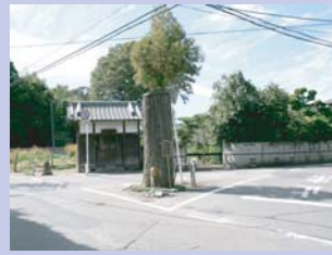
3-4一本杉の辻 三叉路の中心に一本杉の株が残り、石碑などとあいまって特徴的な空間となっています。