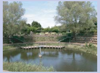
3-5松ヶ崎中央公園 広い芝生広場があり、親水性のある池も整備された公園です。