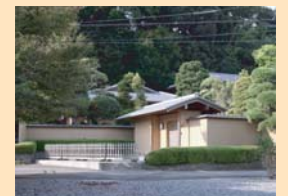
C-3戸張の民家 塀や屋根色など、背景の緑になじむ自然な風合いの屋敷です。

地区計画、建築協定、緑地協定などに定めている地区です。に加え、事務局のフィールドワーク等により、今後景観資源として育てていきたい良好な要素を抽出したものです。