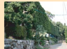
C-2戸張の農家の生垣 長く連続する迫力のある高生垣です。