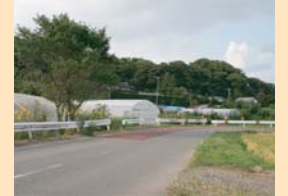
C-1大津川沿いの集落 斜面林を背景とし、高生垣に守られた農家。地域の原風景として大切にしていきたい景観です。