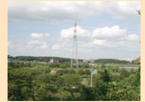
B-2宮前第二緑地からの眺望 高台から手賀沼やその奥に控える斜面林が見渡せます。