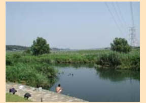
B-1北柏ふるさと公園 手賀沼のほとりにある緑豊かな公園です。