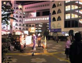
1-19 夜間景観・ストリートライブ 様々なバンドが駅前をにぎわっています。