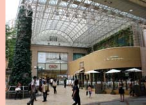
1-5 東口・二番街の街角広場 オープンカフェも開店し、たまりの空間として魅力アップしました。