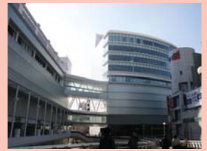
1-2 柏駅西口 駅ビルとデッキが一体的に整備されて西口の新しい顔となっています。