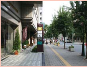
1-7 東口・サンサン通りのホテル前 歩行者空間を提供し、ゆとりを感じさせます。