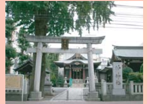
1-20 街の鎮守様・柏神社 古くから駅前のシンボルの施設として親しまれています。