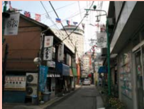
1-17 柏一小通り どこか懐かしさを漂わせる横丁の商店街です。