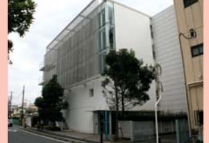
1-15 末広町の事務所ビル 波板の壁が裏の駐車場の目隠しとなっていて、街並みへの配慮が感じられます。