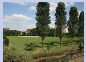
2-6 大堀川防災レクリエーション公園 緊急時の防災拠点として整備された公園で、見晴らしの良い原っぱです。