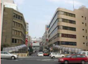
1-12 西口本通り 業務街らしい街並み。低層部には店舗が並びます。