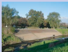
2-4 高田緑地 大堀川に面するまとまった緑地が、公園として保全されています。