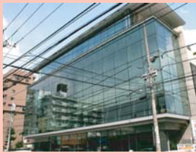
1-9 東口・アミュゼ柏 シースルーのファサードや屋上緑化などが特徴的な公共施設です。