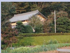
2-3 大堀川沿いの民家 前面に畑地、背景に斜面緑地を配する伝統的な農家の敷地利用です。