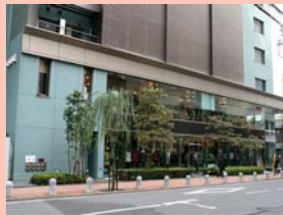
1-8 東口・幸通り 低層部にシースルーのファサードなど街並みに華やかさを添えています。