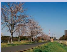
2-5 大堀川の桜 春になると川沿いに満開の花が咲き誇ります。