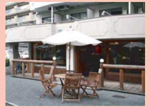
1-10 東口・柏三丁目付近の店舗 近年古着屋や雑貨屋など専門店が出店し、個性化しつつある一角です。