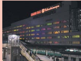
1-18 夜間景観・駅とデパート 開口部デザインを活かした照明が、夜の景観に彩りを添えています。