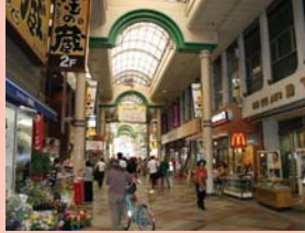
1-4 東口・二番街のアーケード街 最大の人通りと言われる通り。舗装や旗なども楽しい雰囲気です。