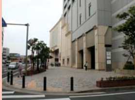
1-14 末広あげほの線のホテル 地区計画などの制度により前面に豊かな歩行者空間を提供しています。