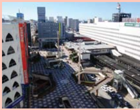
1-1 柏駅東口ダブルデッキ上 東口の多くの人の流れは柏を代表する景観の一つです。

一方、このようなにぎわいや店舗の競合は、広告看板の氾濫や通行をふさぐ商品のはみ出しなど、雑然とした景観と感じられる面もあります。