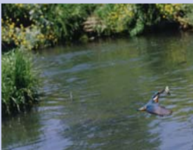
2-1 大堀川に棲むカワセミ 浄化された川を象徴するシーンです。