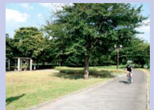
2-2 大堀川リバーサイドパーク 川沿いに遊歩道が整備されています。