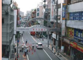
1-13 西口・あさひ通り 業務ビルの低層部に店舗が続いています。