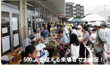
500人を超える来場者で大盛況!