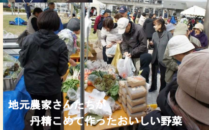
地元農家さんたちが丹精こめて作ったおいしい野菜