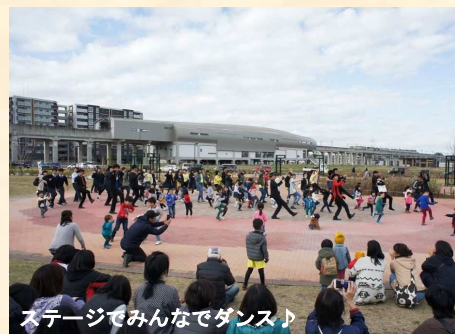
ステージでみんなでダンス♪

平成30年11月24日(土)に柏たなかの収穫祭が開催されました。地元農家さんの新鮮な野菜の直売、餅つきをはじめとする子供ブースや音楽フェスなど、大人も子供も楽しめるイベントとなっています。朝市と同様に毎年の行事ですので、来年の皆様のお越しをお待ちしております。