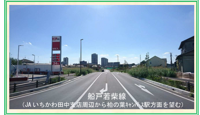
船戸若柴線 (JAいちかわ田中支店周辺から柏の葉キャンパス駅方面を望む)

平成30年7月19日に都市計画道路「船戸若柴線」が開通しました。これにより柏たなか駅～県道我孫子関宿線～国道16号まで1本で通行することが可能となります。国道16号からは都市計画道路「高田若柴線」が柏の葉キャンパス駅方面まで開通しており、2駅間の移動がますます便利となりました。