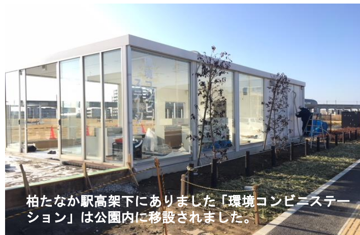
柏たなか駅高架下にあった「環境コンビニーション」は公園内に移設されました。