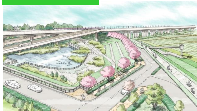
イメージ図（鳥瞰図）

柏たなか駅北部に整備されました「川端調整池」は、防災機能の確保と合わせて、周辺と一体感のある景観の形成（安全を大前提として、人々の憩い・集いの場となる空間形成）を検討しており、住民の皆様を含めどのような景観が望ましいのか話し合いをすすめているところです。今後も地域の皆様のご意見を広く取り入れ、より良い景観形成を目指してまいります。