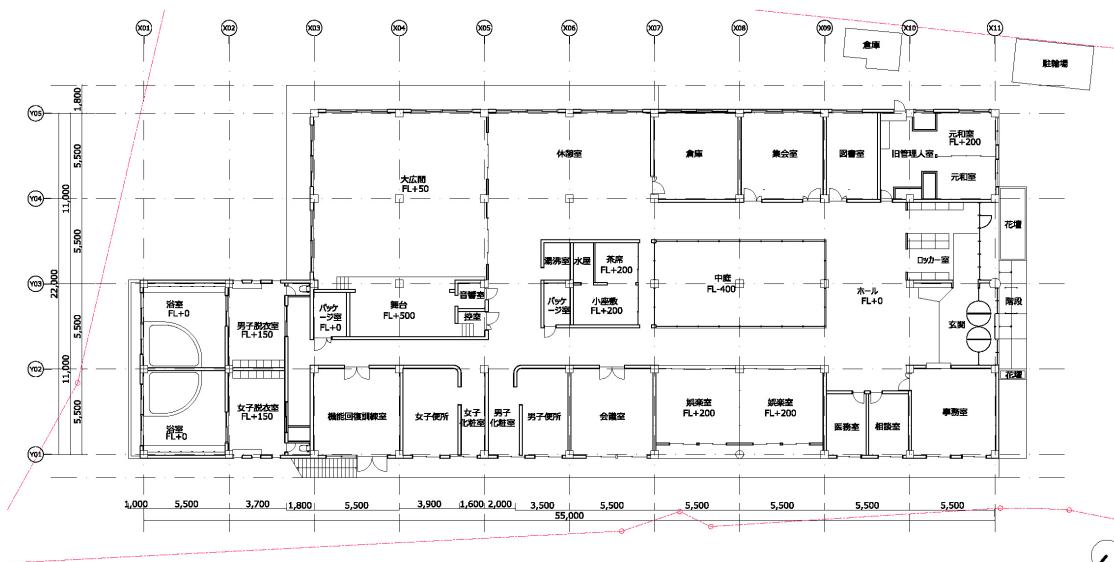
1F平面既存図 S=1:250 (A4)

既存平面図を配布し、館内を参加者と共に見て回り、 既存建物で気になる箇所について確認をしてもらった。