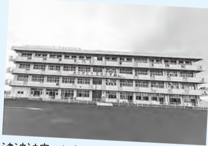
津波被害の教訓を継承するために震災遺構として整備された仙台市立荒浜小学校