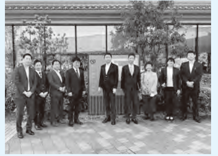
市立伊勢総合病院