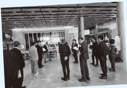
「日々何かが起こり、誰かと出会う」を設計コンセプトにした「おにクル」現地視察の様子

一般公募で応募総数2,667件の中から、茨木市内に住む当時6歳の男の子の案で決定しました。「こわい鬼さんでも楽しそうであつちやうとこ」という意味が込められているそうです。