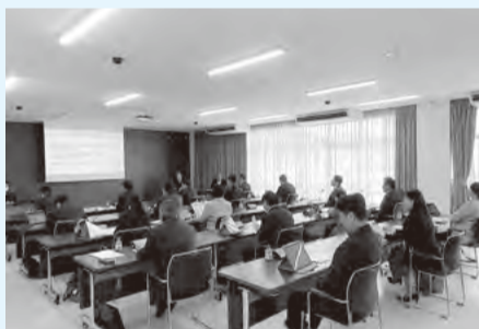
取手市議会視察の様子