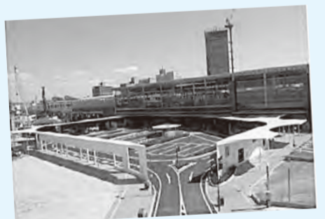
九州新幹線の開業や熊本地震をきっかけに整備が進められた熊本駅前