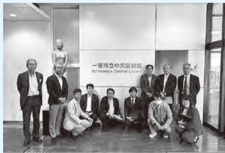
一宮市立中央図書館