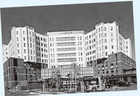
令和元年に現地建て替えを経て新たに開院した小牧市民病院