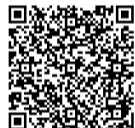
▲千葉県のホームページはこちら