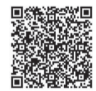
▲市のホームページはこちら

7月5日時点における市内の新規陽性者数等の推移については次のとおりです。市内で判明した新型コロナウイルスの感染者情報については、市のホームページでお知らせしています。