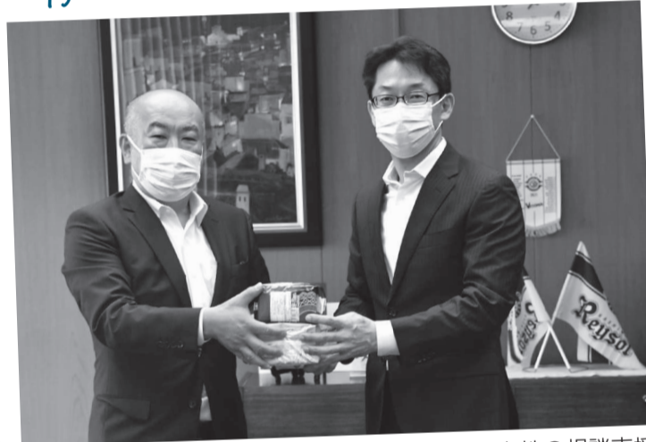
物流を扱う市内企業から、生活に困っている女性の相談支援につながればと、生理用品約1,500パックが寄贈されました。