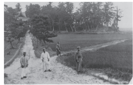
▲1911(明治44)年 布施弁天に続く松並木の参道

老朽化で枯れてしまったり、利根川氾濫による復興のため換金されたりしたためか、雑木林や畑になっていた。そのことを当時の住職が憂い、初めての再生事業として桜の苗木を植えた。しかし、その数年後に徳川幕府が倒れ、旧幕府軍が北に向かう際、布施に駐留したことで再び荒廃した。