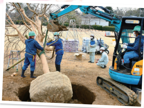
▲新たに植樹したシダレザクラ

目標とする景観に向け、市と千葉大学は、地域住民との打ち合わせや樹木医等との実態調査を重ねながら工事計画を設計。計画には新たな桜の植栽だけでなく、年老いた桜も守れるよう、枝葉の剪定(せんてい)や土壌改良も組み込まれました。