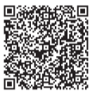
▲市のホームページはこちら