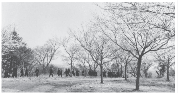
▲1959(昭和34)年 戦後に植えたソメイヨシノが咲いている

戦時下では公園が畑として利用されることになり、再び桜はその姿を消す。戦後、桜の名所として復活すべく、数百本の桜を植樹。現存している園内の古い桜はこの時代のものであると考えられる。後に柏市がさくら山の土地を取得し、1970年には「あけぼの山公園」が開園。同公園の一部として、現在につながるさくら山となる。