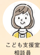
こども支援室 相談員

子育ての悩みから児童虐待に関することまで、毎日さまざまな相談を受けている市の相談員にインタビューしました。