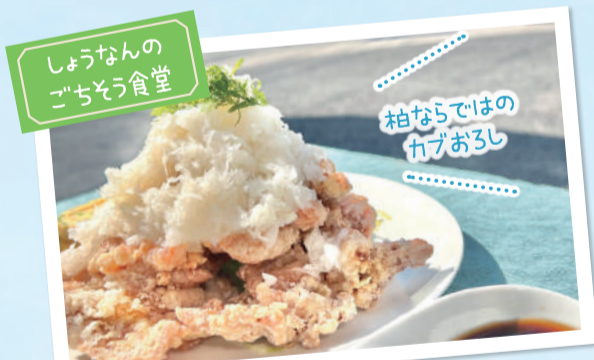
しょうなんのごちそう食堂

市内で採れた農産物を使ったメニューを楽しめるレストランがオープン。さらに地元食材を使った焼き立てパンが買えるベーカリー、絶品ピーナッツソフトクリームを味わえるピーナッツ専門店など、どれも食通をうならせるものばかりです。