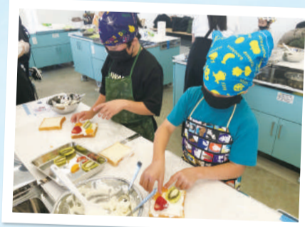
▲子どもから大人まで参加できる料理教室