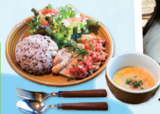
←一番人気のグリルチキン

営業開始時間／午前11時※火・水曜日は定休 所在地／呼塚新田204-23 ☒北柏駅から、徒歩10分 ☒有料の駐車場あり ☒営業時間や予約等について＝花小鳥 ☎7196-6301・公園の管理について＝柏市みどりの基金 ☎7160-3120