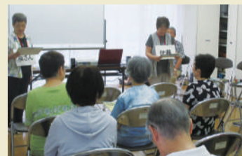
▲寸劇を披露し、消費者トラブル事例を紹介

地域のサロンや会議等で、消費生活センターに多く寄せられる相談事例などを、チラシやパンフレットを活用したり寸劇を披露したりして皆さんに伝えています。消費生活コーディネーターが参加する集まりを見かけたら、ぜひご参加ください。