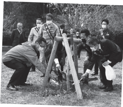
3/24 松ヶ崎城跡に河津桜などを寄贈 @松ヶ崎城跡

松ヶ崎城跡に、柏ロータリークラブから河津桜20本などの植物が寄贈され、会員の皆さんの手により植樹されました。