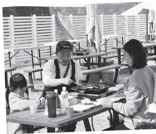
3/27 海辺気分でバーベキュー @あけぼの山農業公園

3月にリニューアルオープンしたカフェ「ビーチパーク」には、砂浜をイメージしたテラス席でバーベキューを楽しむ家族の姿が見られました。