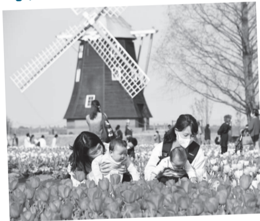
3/27 花畑を彩る6色のチューリップ @あけぼの山農業公園

風車の広場に並んだ16万球の色とりどりのチューリップに、訪れた人もマスクの下で顔をほころばせていました。