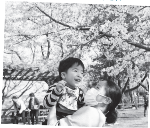
3/27 春満開! 350本の桜がお出迎え @あけぼの山農業公園

春の訪れを感じられる市内でも人気の花見スポット、あけぼの山農業公園のさくら山。訪れた人は、距離をとって散歩しながら、満開の桜を楽しんでいました。