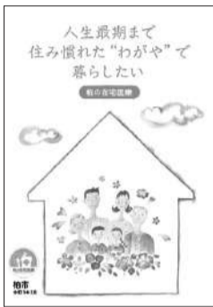
▲柏の在宅医療ブックレット