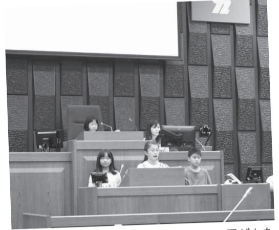
理想の未来の柏市の実現に向けて、子どもたちが柏市へ提言を行いました。