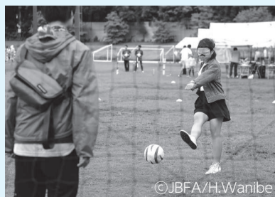
▲パラリンピック競技のブラインドサッカー