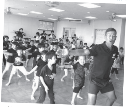
柏ハカを継承するため、柏市ラグビー協会によるハカ教室が保育園で初開催されました。

8/29 ニュー・ジージーランド伝統舞踊ハカの柏オリジナル版「柏ハカ」を子どもたちに伝授!