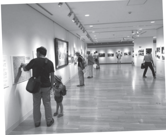
市内の幹線道路とその周辺写真を通して柏の変遷を振り返る写真展が開催されました。