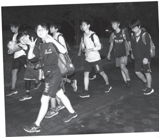
午後9時ごろから明け方にかけて、市内の中学生が市内約30キロメートルを歩きました。