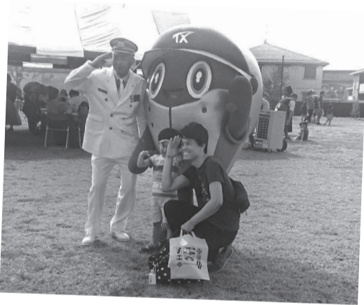
参加者は駅長さんやTXのキャラクター・スピーフィーとの写真撮影等を楽しんでいました。