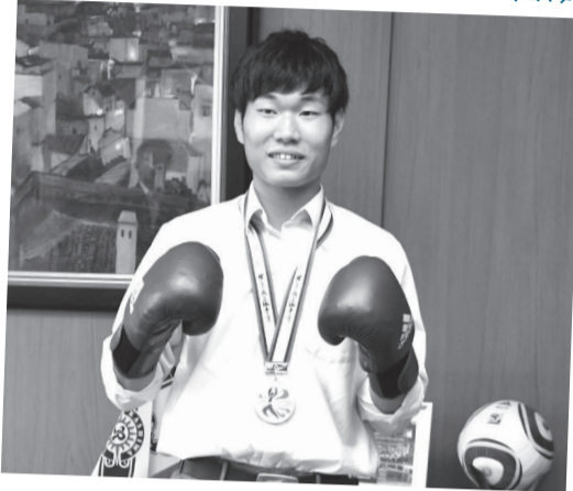
ライトウェルター級で悲願の優勝を果たし、柏市長に喜びの気持ちを報告しました。