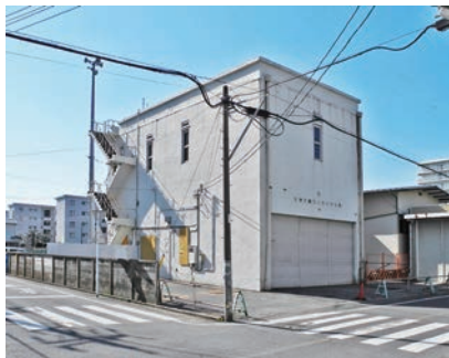
訓練棟正面と東側面

お祝い会では、国登録有形文化財への登録答申を記念し、建物の歴史についての講演会や、地元高野台にお住まいの方による座談会を行います。