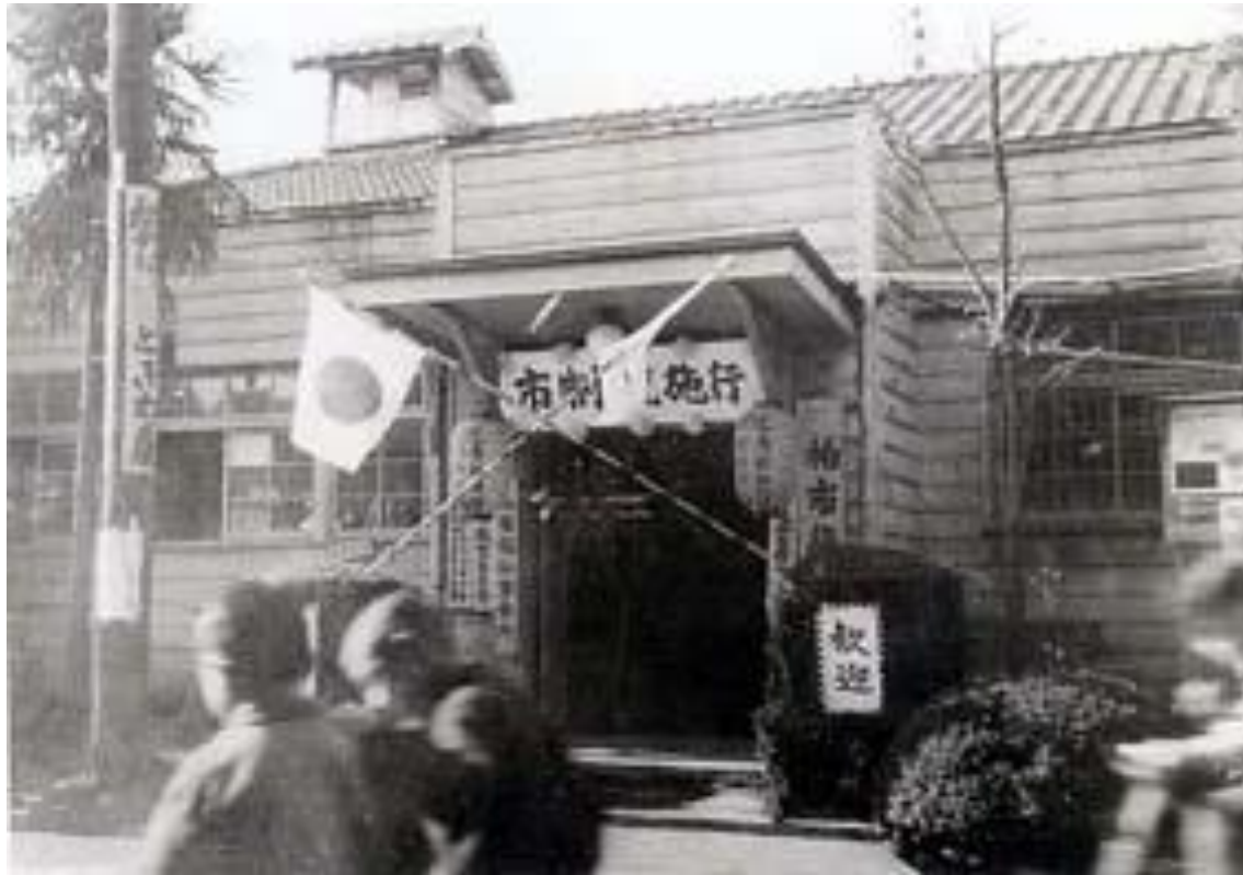
市制祝賀(昭和29年、平川徳之氏撮影)