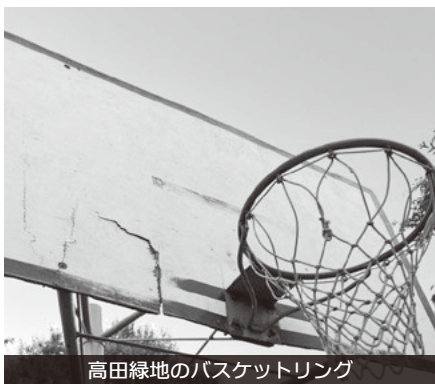
高田緑地のバスケットリング