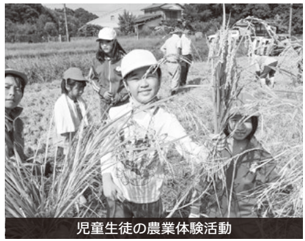
児童生徒の農業体験活動

A 指定ごみ袋統一について、令和6年4月からの実施に向けて準備を進めているところである。指定ごみ袋の統一から、おおむね1年程度は、これまでの指定ごみ袋も使える経過措置期間も設ける。価格については、店頭ごと自由に価格を決め、販売してもらうものであり、市内一律に販売価格を設定できるものではない。