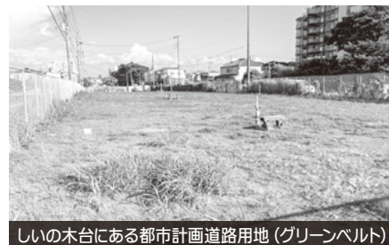
しいの木台にある都市計画道路用地 (グリーンベルト)