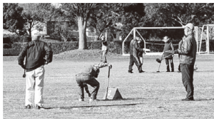
グラウンドゴルフの様子 (写真はイメージ)