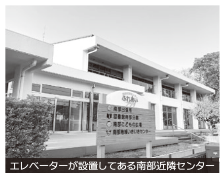
エレベーターが設置してある南部近隣センター