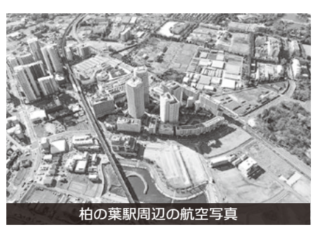
柏の葉駅周辺の航空写真