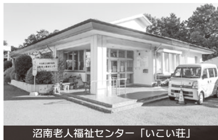
沼南老人福祉センター「いこい荘」

A 生きがい創出や健康寿命延伸、センターの有効活用にも寄与する重要な視点のため、あらゆる可能性を検討していく。