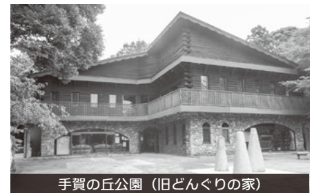
手賀の丘公園(旧どんぐりの家)

A 自然と歴史、文化に触れることができる戸張地区で地域計画に基づく市民活動団体による文化財トレイルの取組などモデル的な取組に期待している。