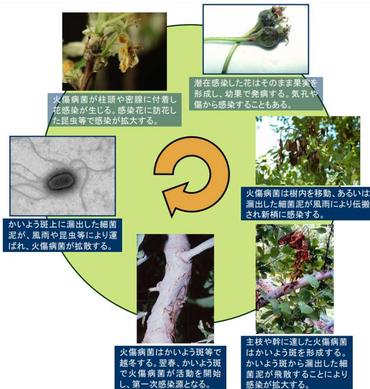
図1. 火傷病菌の伝染環

「火傷病菌の生態およびその病徴について(火傷病の病徴写真とその解説)」 消費・安全局植物防疫課・植物防疫所より