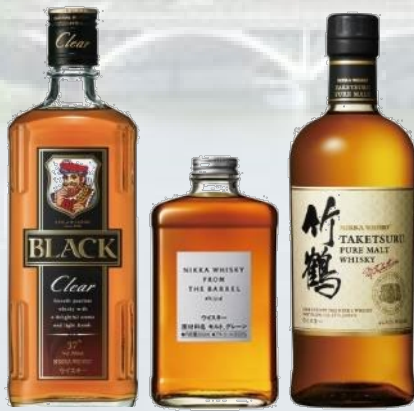
ニッカウヰスキー