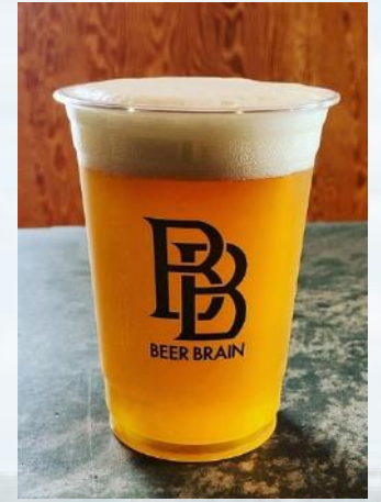
BEER BRAIN Taproom