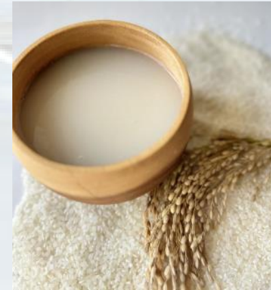
エグチライスファーム