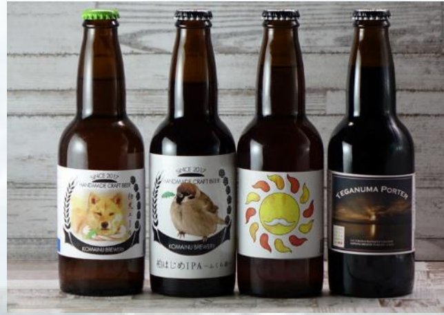
こまいねブルーリー