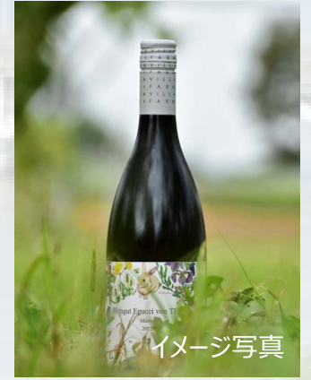
Weingut Egucci von TEGA