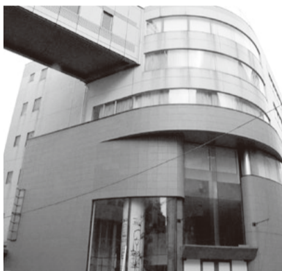
【賃借予定地】 旧そごう柏店 アネックス館