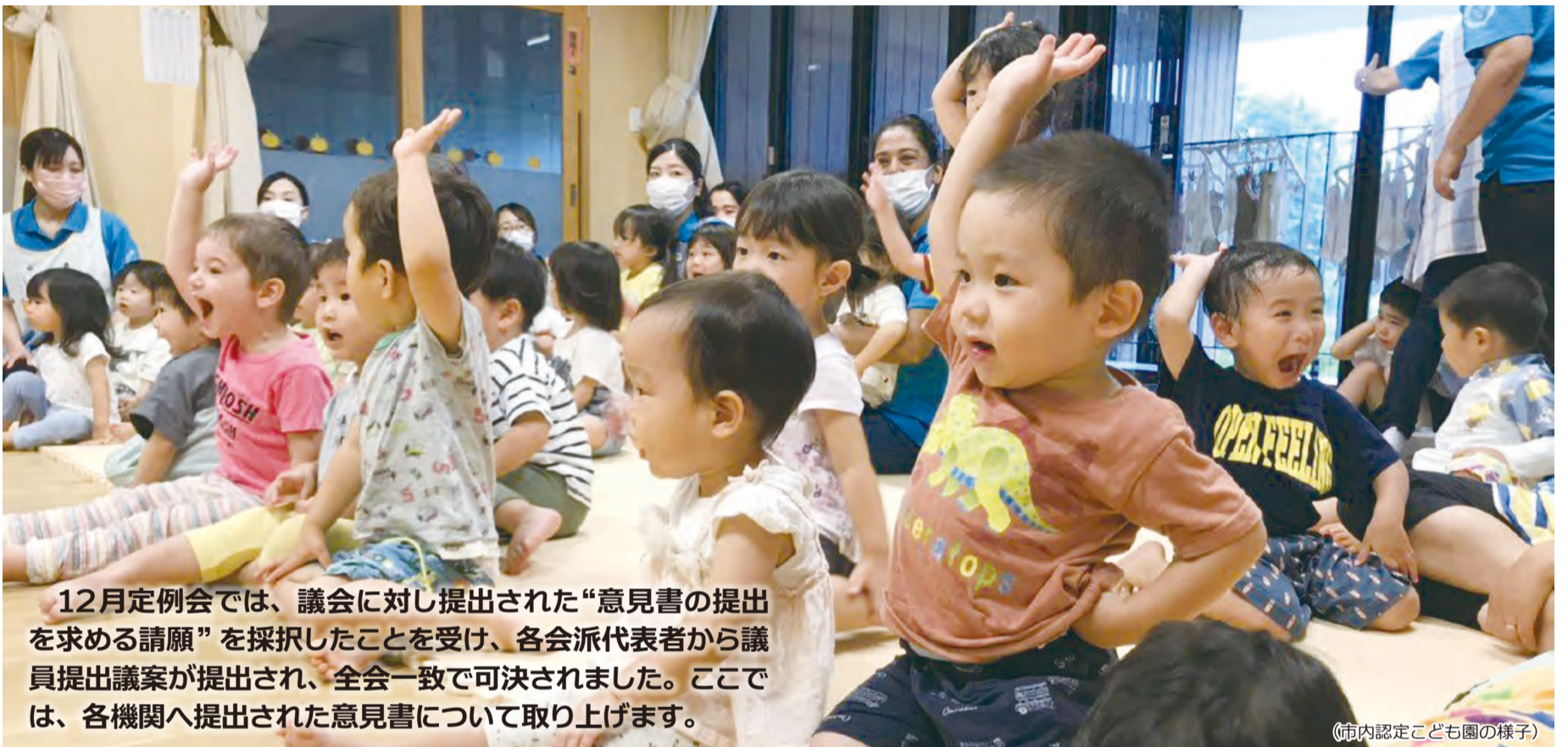
(市内認定こども園の様子)

12月定例会では、議会に対し提出された“意見書の提出を求める請願”を採択したことを受け、各会派代表者から議員提出議案が提出され、全会一致で可決されました。ここでは、各機関へ提出された意見書について取り上げます。