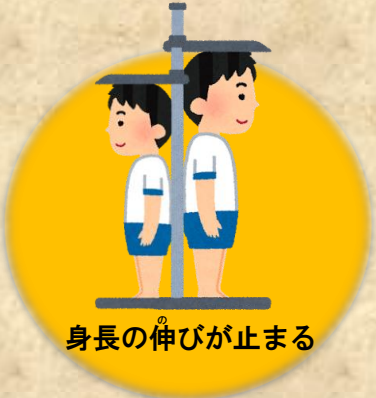
身長伸びが止まる