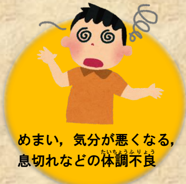
めまい、気分が悪くなる、 息切れなどの体調不良