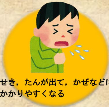
せき、たんが出て、かぜなどに かかりやすくなる