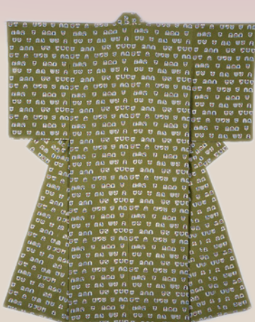
小花入爪文緑地縮緬着物