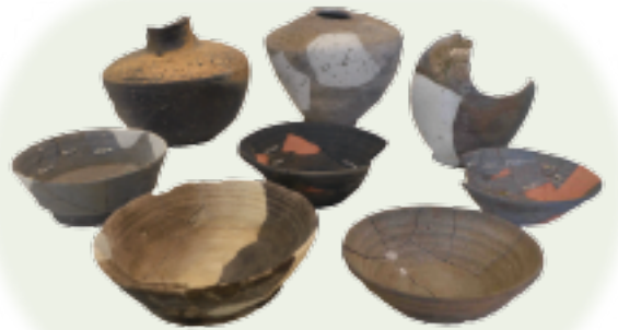
茨城県や東海地方でつくられた土器

地域の独自性は、それぞれの地域の自然環境や、そこで育まれてきた歴史によって様々です。このシリーズでは、柏市内の各地域を取り上げ、その地域に眠る歴史や文化財を掘り下げることによって、各地域の特質を探ります。