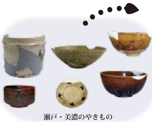
瀬戸・美濃のやきもの