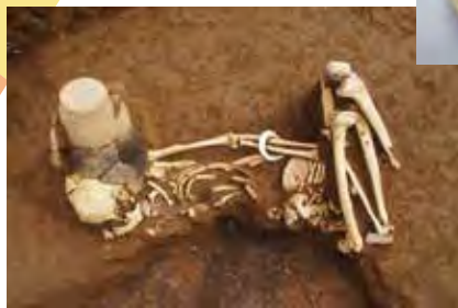
廃屋墓の人骨 (松戸市秋山向山遺跡)