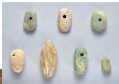
ヒスイ製大珠 (柏市小山台遺跡)