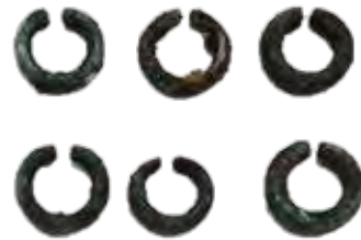
耳環 (市川市若宮八幡遺跡)