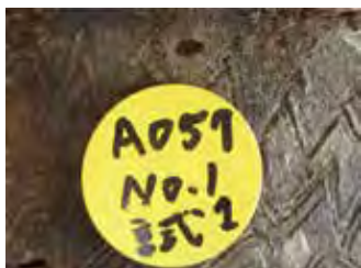
弥生土器の種子圧痕(八千代市)