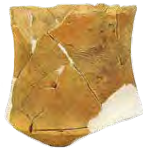
縄文土器 (船橋市夏見台西遺跡)