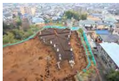
緒ヶ崎三本松古墳 (流山市)

今回の企画展では、千葉県北西部地区の縄文時代から現代まで、幅広い時代を対象とします。各市の発掘調査や研究の成果から、当時の人々のまちづくりや暮らしの様子をご紹介しますとともに、ごく身近な街なかにある遺跡や文化財について考えていきます。