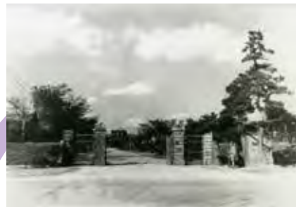
陸軍柏飛行場正門 (柏市)