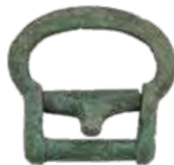
鉸具 (習志野市谷津貝塚)