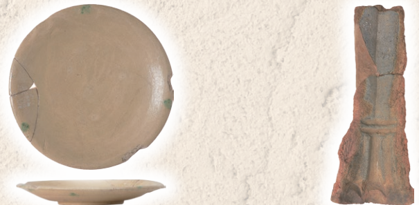
花前Ⅰ遺跡：二彩陶器 (平安時代)