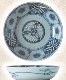
花前Ⅱ-1遺跡：染付鉢 (江戸時代)