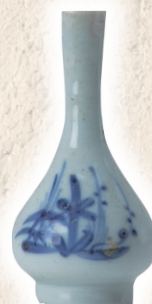
馬土手(2)：染付花文小形瓶 (江戸時代)