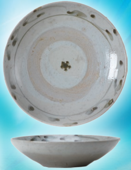
柏市花前Ⅱ-1遺跡出土の染付皿