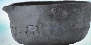
柏市花前Ⅰ遺跡出土の銅製柄杓