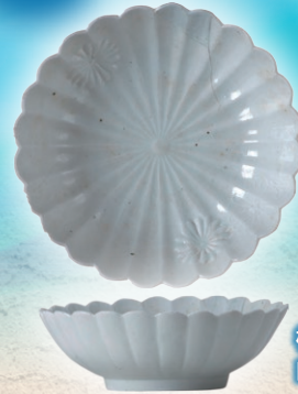
柏市花前Ⅱ-2遺跡出土の白磁鉢