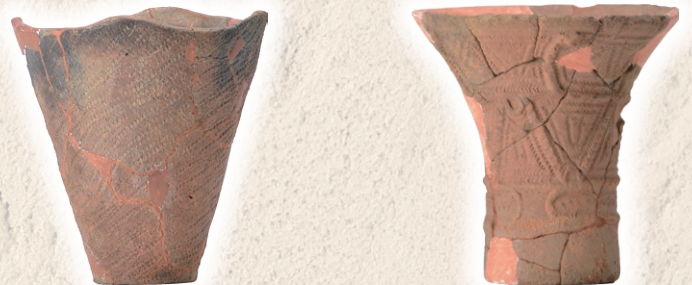
花前Ⅰ遺跡：縄文土器 (前期)