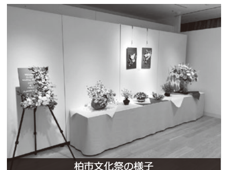
柏市文化祭の様子

A 合同展示会など様々な取組の周知とともに活動を幅広く継続して行っていけるよう支援していきたい。