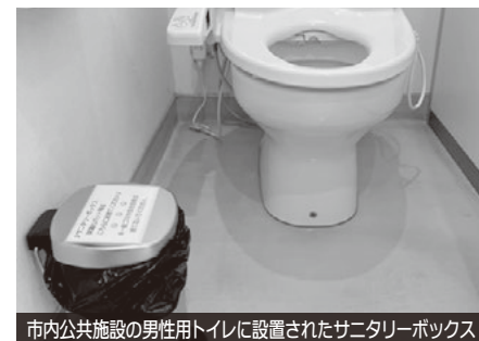
市内公共施設の男性用トイレに設置されたサニタリーボックス