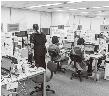
柏市コロナフォローアップセンター内部の様子

A まさに協定は大切だと考えている。例えば廃棄物関係であれば、廃棄物処理業者と協定を結んで速やかに処理を行っていくことや、必要な備蓄品に関しても様々な業者と協定を結んで、有事に備える体制を整えている。今後もこのような取組を以前にも増して進めていきたい。