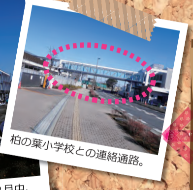
柏の葉小学校との連絡通路。