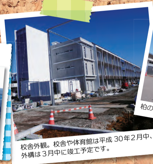
校舎外観。校舎や体育館は平成30年2月中、外構は3月中旬に竣工予定です。