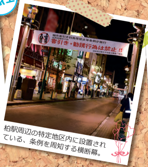
柏駅周辺の特定地区内に設置されている、条例を周知する横断幕。

こんな質問がありました Q 条例制定後の取り組みによる効果は。 A 現在のところ公共の場所での客引き行為等は減少している。まちの方々からは「歩きやすくなった」「怖かったが、パトロールがいてくれて助かる」といった激励の声もいただいております。一定の効果はあったと認識しています。