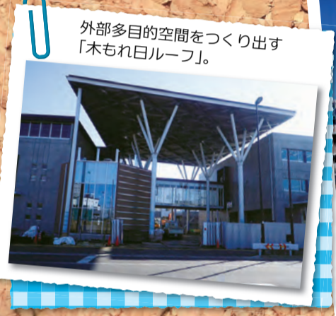
外部多目的空間をつくり出す「木もれ日ルーフ」。