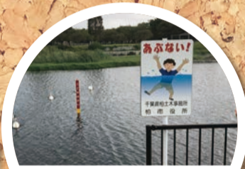
子供にもわかりやすい看板と、水深が深くなる位置に設置されたブイ