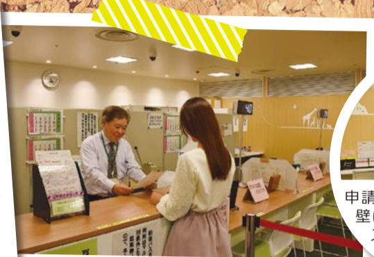
窓口にて申請の手続きを受け付けています。平成30年10月～12月の申請件数は、2,934件です。