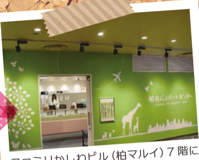
ファミリーかわビル(柏マルイ)7階にあります。こちらが入口です。

30年度当初予算が可決され、平成30年10月1日に開設されました。パスポートの申請受け付けや交付を行っています。