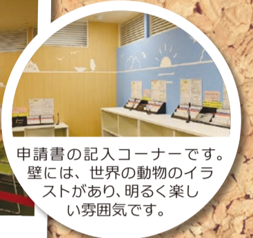
申請書の記入コーナーです。壁には、世界の動物のイラストがあり、明るく楽しい雰囲気です。