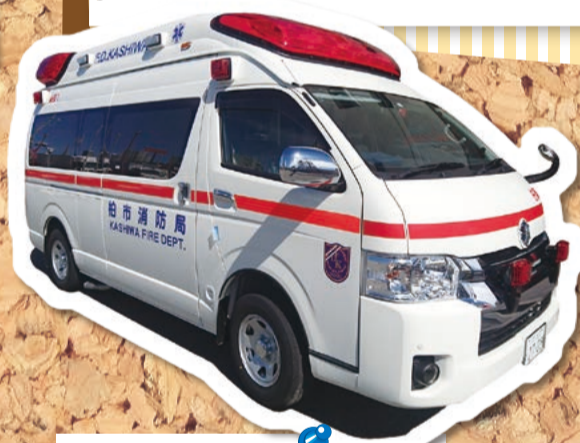
東部消防署逆井分署に配置予定です。(写真はイメージです)