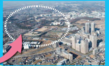
現在の十余三地区