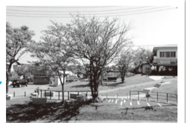
手賀沼フィッシングセンター