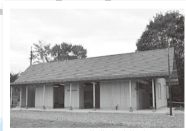
わしのや農業交流拠点

29年度事業 休憩スペース、トイレの整備 決算額 4,080万円 (うち県補助金924万円)