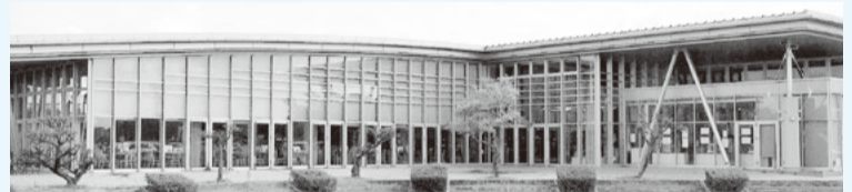
道の駅しょうなん

【その他の内容】農家の後継者や新規就農者支援■若者の就労支援の拡充・強化■市内産業の活性化■公設市場の持続可能な施設整備