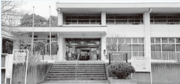
南部近隣センター（現在はリノベーション工事休館中）