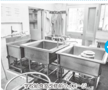
学校給食室改修前のイメージ