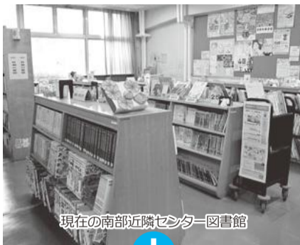
現在の南部近隣センター図書館

既存の建物に大規模な改修工事を行い、間取りの変更も含めて用途や機能を変更して建物の性能を刷新すること。