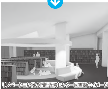
リノベーション後の南部近隣センター図書館のイメージ