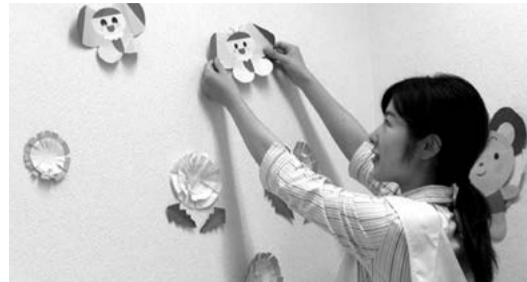
31年度のこどもルーム入所申し込みは11月1日から開始予定です