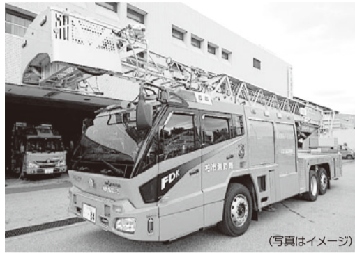
災害対応特殊はしご付消防ポンプ自動車 (写真はイメージ)

現有車は、東部消防署に平成12年1月に配置されてから19年が経過し、車両の老朽化及び自動車NOx・PM法(知)の基準を満たさない規制対象車のため、新たに取得します。