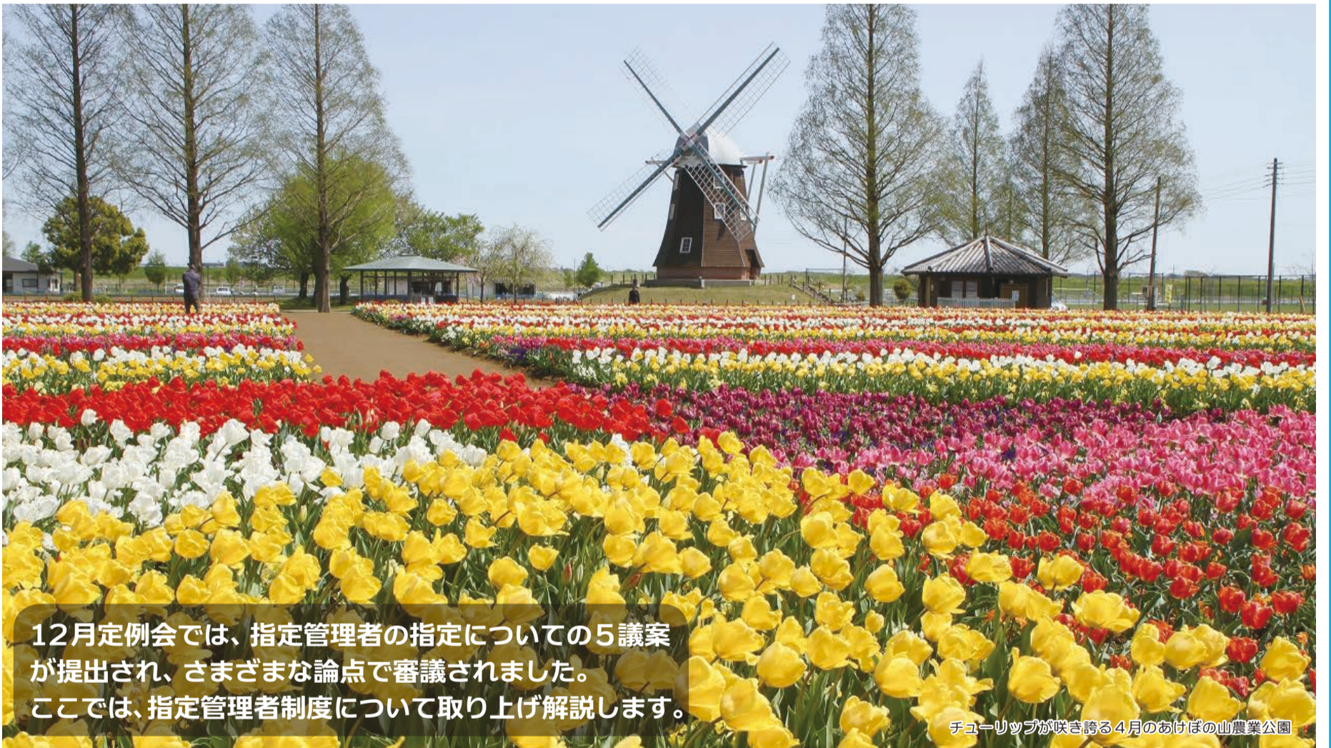
チューリップが咲き誇る4月のあけぼの山農業公園

12月定例会では、指定管理者の指定についての5議案が提出され、さまざまな論点で審議されました。ここでは、指定管理者制度について取り上げ解説します。