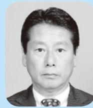
委員長 橋口 幸生 公明党