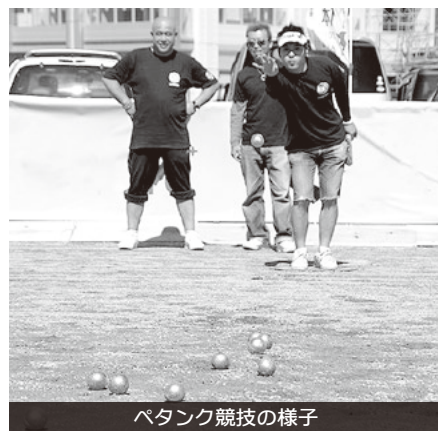
ペタンク競技の様子

A 日本での普及はまだまだだが、パリ五輪で競技種目になる可能性があると言われる。市民のスポーツ実施率を高める面からも、ペタンク協会と連携した普及啓発を検討していく。