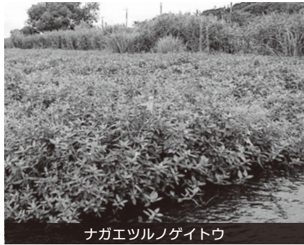
ナガエツルノゲイトウ

らからでも成長し繁殖するため、一度繁殖域が広がると抑えることが困難になる。どのように駆除を行うのか。