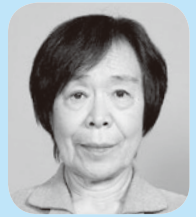
副委員長 日下 みや子 日本共産党