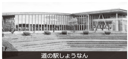
道の駅しようなん

A手賀沼周辺地域を代表する農業及び地域振興を強く印象づける施設であるべきと考える。拡張後の道の駅が手賀沼周辺地域のエントランスとして、多様な利用がされて道の駅と認知されるよう準備を進める。6次産業化など多様な農業が展開可能となっており、こういった農業のポテンシャルに魅力を感じ、意欲の高い農家を積極的に支援していく。