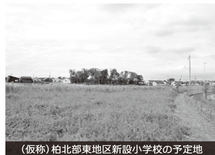
(仮称) 柏北部東地区新設小学校の予定地

何よりも重要と考えており、現在地域と学校関係の方々から御意見を聞いている。最終的には、柏市通学区域審議会 知+ に諮問し御審議いただくが、できる限り地域の御意見に寄り添い、合意形成を図りながら進めていく。