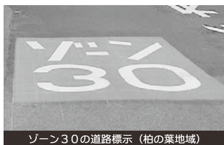
ゾーン30の道路標示 (柏の葉地域)