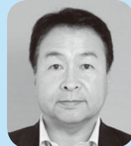
委員長 田中 晋 公明党