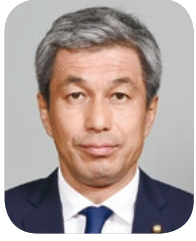
副議長 中島 俊

市民の皆様には、日頃より、市議会に対し、深い御理解と御協力を賜り、心より御礼申し上げます。このたび私たちは、9月議会におきまして、議員各位の御推挙をいただき、議長並びに副議長に就任いたし、その使命と職責の重大さを痛感しております。