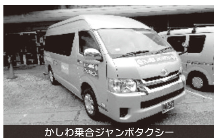
かしわ乗合ジャンボタクシー