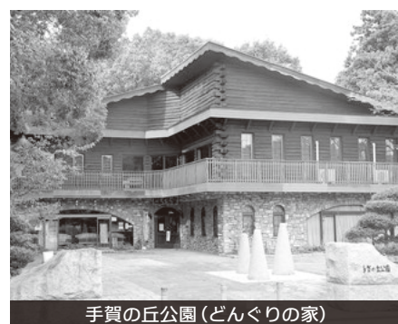
手賀の丘公園(どんぐりの家)

Q 食と農の総合戦略の展開、手賀沼アグリビジネスパーク事業について、手賀曙橋、手賀沼フィッシングセンターや手賀の丘公園等の活用の余地がある。この付近一帯を体験型パークとすれば、道の駅