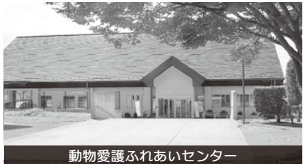
動物愛護ふれあいセンター

及び猫の殺処分ゼロに対する考えと取り組みについては、保護・収容される全ての動物を命あるものと重く受けとめ殺処分ゼロを目標に、できる限り多くの動物に生きる機会を与えられるように努めているところである。飼い主のいる動物は、できるだけ速やかに返還し、譲渡適性のある動物は里親への譲渡を推進している。