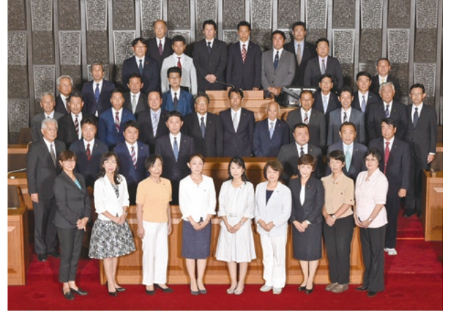
第18期柏市議会議員と市特別職